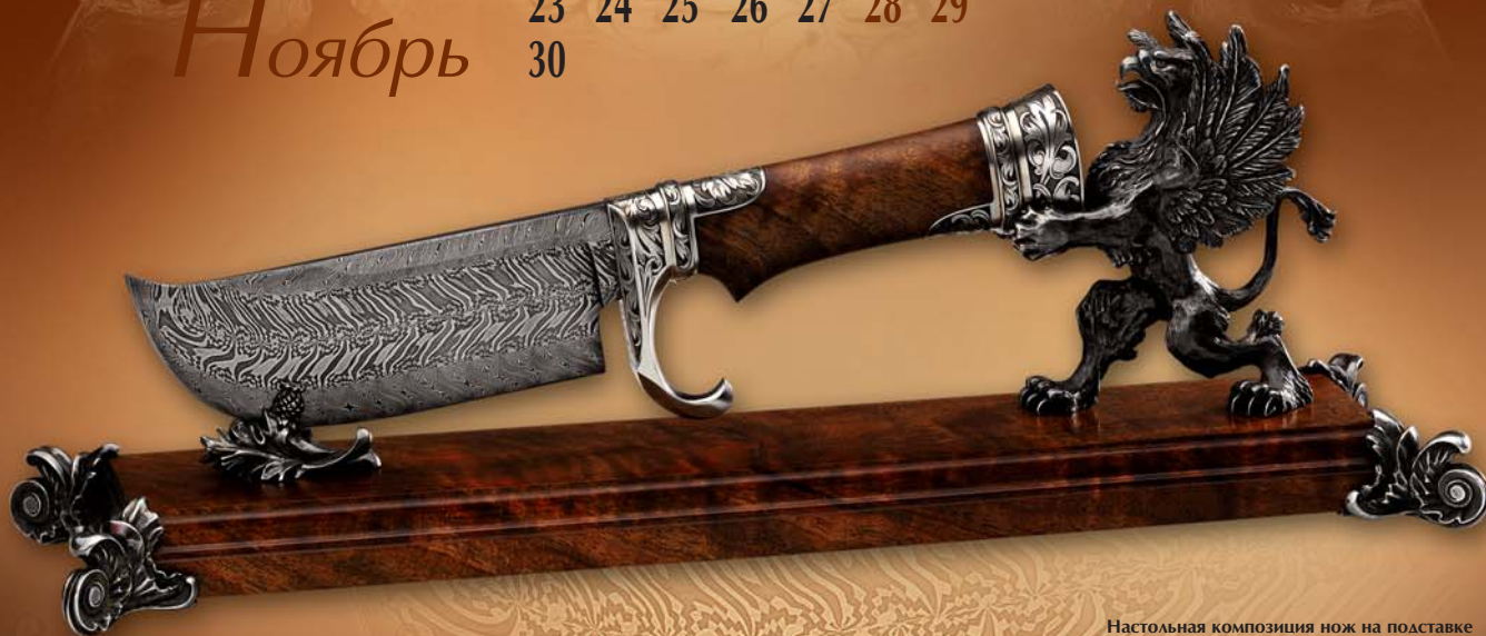
Настольная композиция нож на подставке «Грифон»

Тула, 2007 г. Автор – О. Семёнов. Дамаск – Р. Окушко, С. Епишкин. Слесарные работы – В. Чурбанов. Литьё – А. Дроздов. Ковка, литьё, обронная гравировка, оксидирование, никель-велюр покрытие. Дамаск, сталь, белый металл, орех.